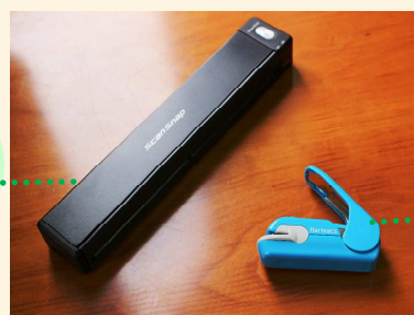
コクヨ ハリナックス プレス